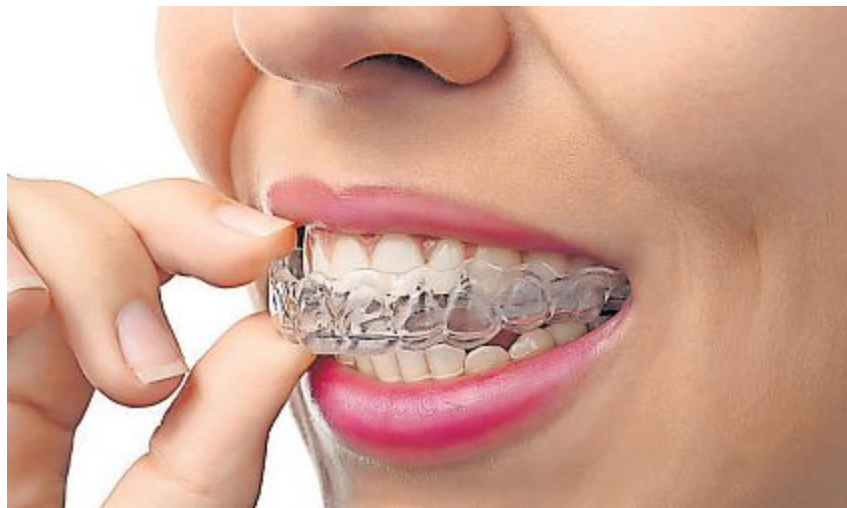
Neu können Patienten kleinere Zahnfehlstellungen mit Alignern korrigieren lassen.

Das zahnarztzentrum.ch am Bahnhof in Winterthur feiert diesen Monat sein 10-jähriges Bestehen. Neu können Patienten auch bei Allgemeinzahnärzten kleinere Zahnfehlstellungen korrigieren lassen. Mit kaum sichtbaren, herausnehmbaren Alignern.